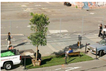
Le tout premier park(ing) à San Francisco en 2005.

Lancée pour la première fois en 2005 à San Francisco par le collectif d'art urbain Rebar , avec un seul emplacement de parking occupé, l'initiative Park(ing) Day s'est démultipliée pour devenir un événement mondial rassemblant plusieurs centaines de projets répartis dans plus de 100 villes ces dernières années.